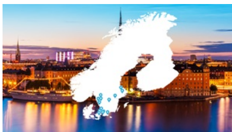
Här finns vi