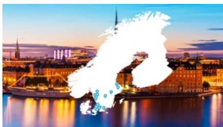
Här finns vi